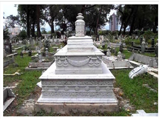
Pandangan Makam dari bahagian hadapan.