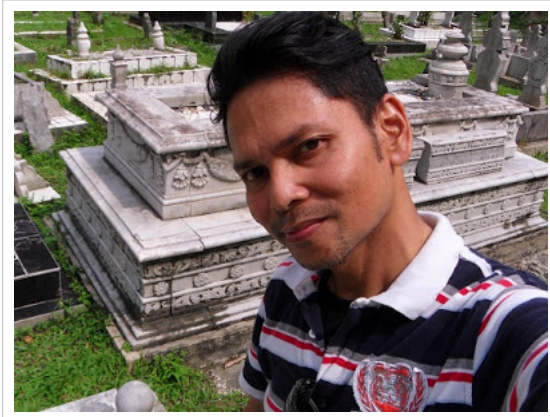
Gambar ini Syah ambil pada hari Sabtu bersamaan 01 Disember 2012 dan beginilah keadaan makam Al-Marhum Raja Alang ketika itu. Shukur Alhamdulillah iannya sudah dibaik pulih.