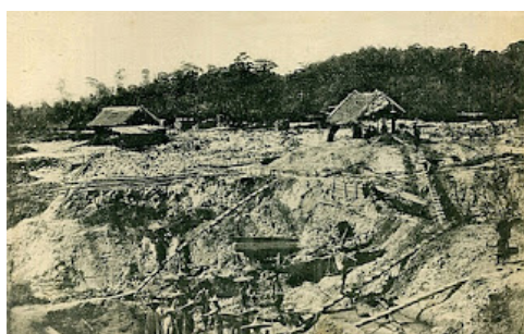
Gambar 1: Salah satu daripada lombong bijih timah terawal di Kuala Lumpur. Perebutan Hak Perlombongan dan Perdagangan Bijih Timah ini mengundang kepada teretusnya Perang Kelang di antara Kerabat Diraja Selangor.

Perang Kelang ataupun Perang Saudara Selangor berlaku dari tahun 1867 hingga 1874 bermula dengan perbalahan antara kerabat Diraja Selangor iaitu Raja Abdullah bin Raja Jaafar selaku Penguasa Daerah Klang dan Raja Mahdi bin Raja Sulaiman selaku anak bekas Penguasa Daerah Klang yang dipecat iaitu Raja Sulaiman. Perbalahan ini berlarutan sehingga menjadi perang saudara di mana Raja Abdullah yang disokong oleh pakatan Bangsawan Diraja Bugis dan Kongsi Gelap Hai San berperang dengan Raja Mahadi yang disokong oleh pakatan Melayu Sumatera Mandeling & Rawa dan Kongsi Gelap Ghee Hin. Pada awalnya, Raja Mahadi berjaya menewaskan Pakatan Raja Abdullah dan menawan keseluruhan Klang dan Kuala Lumpur di samping menaikkan Yap Ah Loy (Kongsi gelap Hai San) sebagai Kapitan Kuala Lumpur. Sultan Selangor kemudian melantik Tengku Kudin menggantikan tempat Raja Abdullah dan bekerjasama dengan pihak British dan tentera Negeri Pahang untuk menentang pemberontakan Raja Mahadi ini. Melihat keadaan yang lebih memihak kepada Tengku Kudin, maka Yap Ah Loy telah mengkhianati pakatan Raja Mahadi dan bertindak menyokong pakatan Tengku Kudin pula. Oleh kerana itu, Raja Mahadi telah berpakat dengan bekas ketua Yap Ah Loy iaitu Chong Chong dan Syed Mashoor untuk menyerang Kuala Lumpur dan memburu Yap Ah Loy yang telah mengkhianati beliau itu. Maka bermulalah di sini The Battle of Kuala Lumpur.