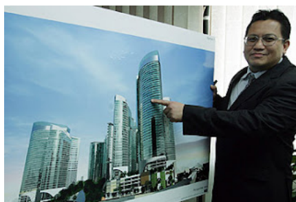
pemaju senyum je dapat banyak duet. bilion2 tu..

Apakah itu? Itulah dia BUKIT BINTANG CITY CENTER yang sedang dibina diatas tapak yg sama.