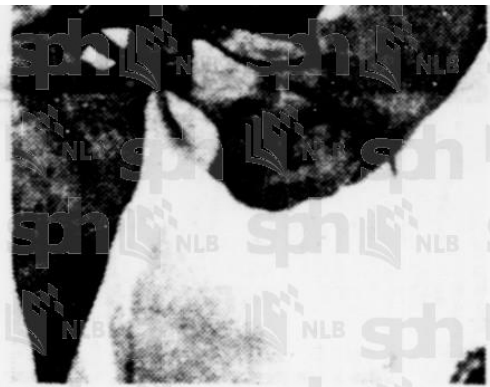
TENGGU . . . benar2 Bapa Malaysia berkalibar