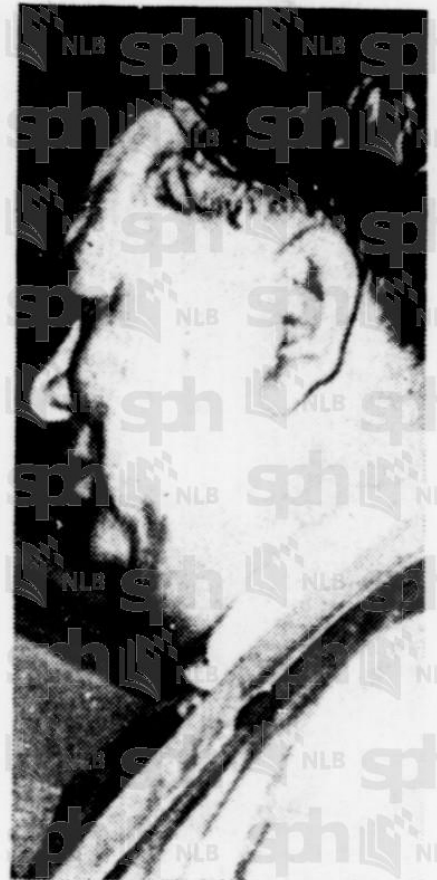
SULTAN . . . terima kaseh daripada semua pehak